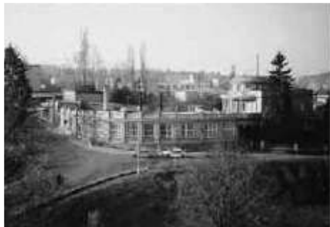
Současný pohled na ateliér