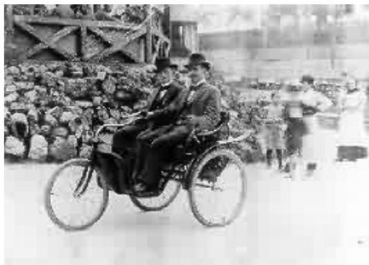
Krajská výstava 1899 v Červeném Kostelci - předvádění tříkolového motorového velocipedu Slávia, firmy Laurin a Klement z Mladé Boleslavi