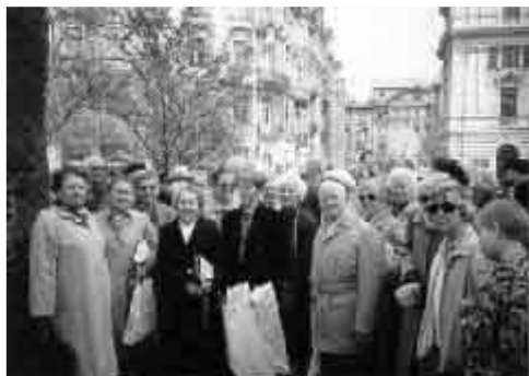
Odhalení pomníku bratří Čapků v Praze, Klub bratří Čapků Trutnov.