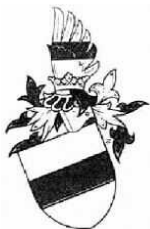
Znak Zárubů z Hustiřan