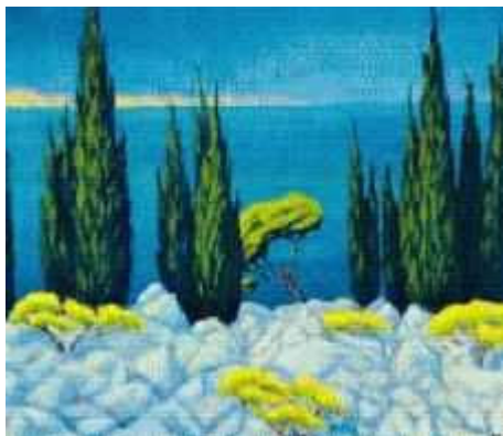
Josef Lisák: Pod Velebitem (Pobřeží Jadranu), olej, 1967

Jsou lidé, kteří neradi opouštějí svůj domov, neradi se vydávají na cesty. Jsou však i tací, pro něž je dálka výzvou. Jsou lidé, kteří proplují životem a příliš se neptají proč. Jsou však jiní, pro něž je výzvou celý život. Neustále se táží a na své otázky se pokoušejí najít odpovědi.