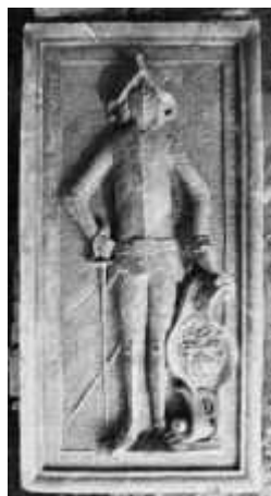
Náhrobek Václava Burgermeistra z Villarsburgu

Při přípravě na velkou opravu interiéru děkanského kostela nejsvětější Trojice v Novém Městě nad Metují bylo 3. března 2001 nalezeno pod podlahou středního bloku lavic před předním pilířem kůru, v úrovni pískovcové a cihelné dlažby, šest pískovcových náhrobních kamenů a jeden pod úrovní dlažby v koutě niky pod postranním oltářem.