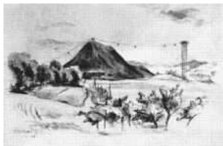
Výsypka dolu Ida koncem války

Dolování uhlí na Svatoňovicku, pronikající z jižních svahů do hlubin Jestřebích hor, kde je černé bohatství uloženo, se již stalo minulostí. Po čtyřech stech letech se poslední důl, poslední vstup do podzemní říše permoníků, v roce 1990 uzavřel. Skončilo dolování, které bylo po dlouhá staletí charakteristickou a určující lidskou činností tohoto regionu. Nám dnes zbývá čas na vzpomínání a odbornou dokumentaci.