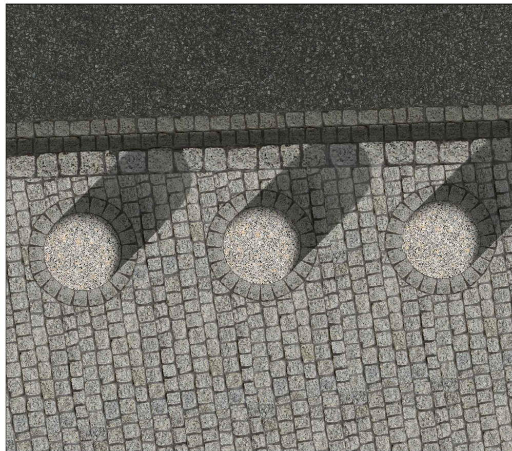
02. DETAIL- žulové patníky a obrubník do ulice 5. května