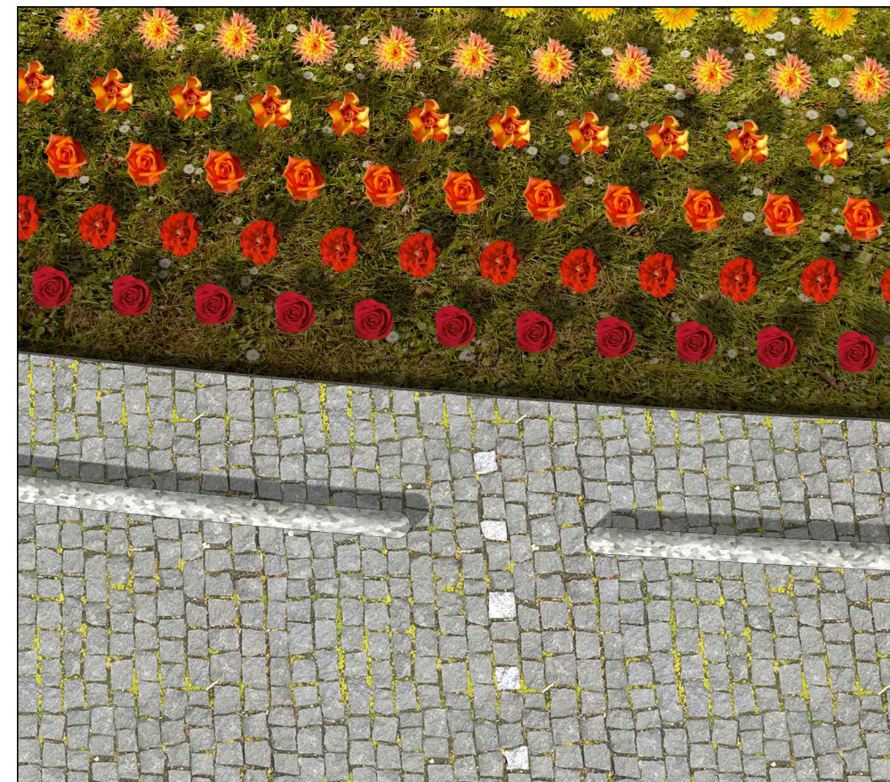
03. DETAIL- parkovací stání, zarážky a osázení záhonu