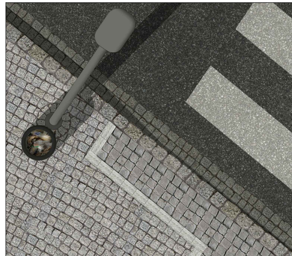
06. DETAIL- posunutý přechod pro chodce ulice 17. listopadu