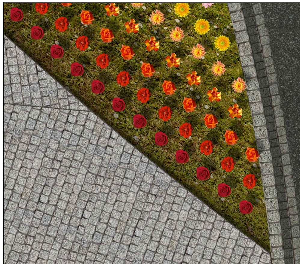
05. DETAIL- osa zvonice v dlažbě, osázení a ulice Sokolská