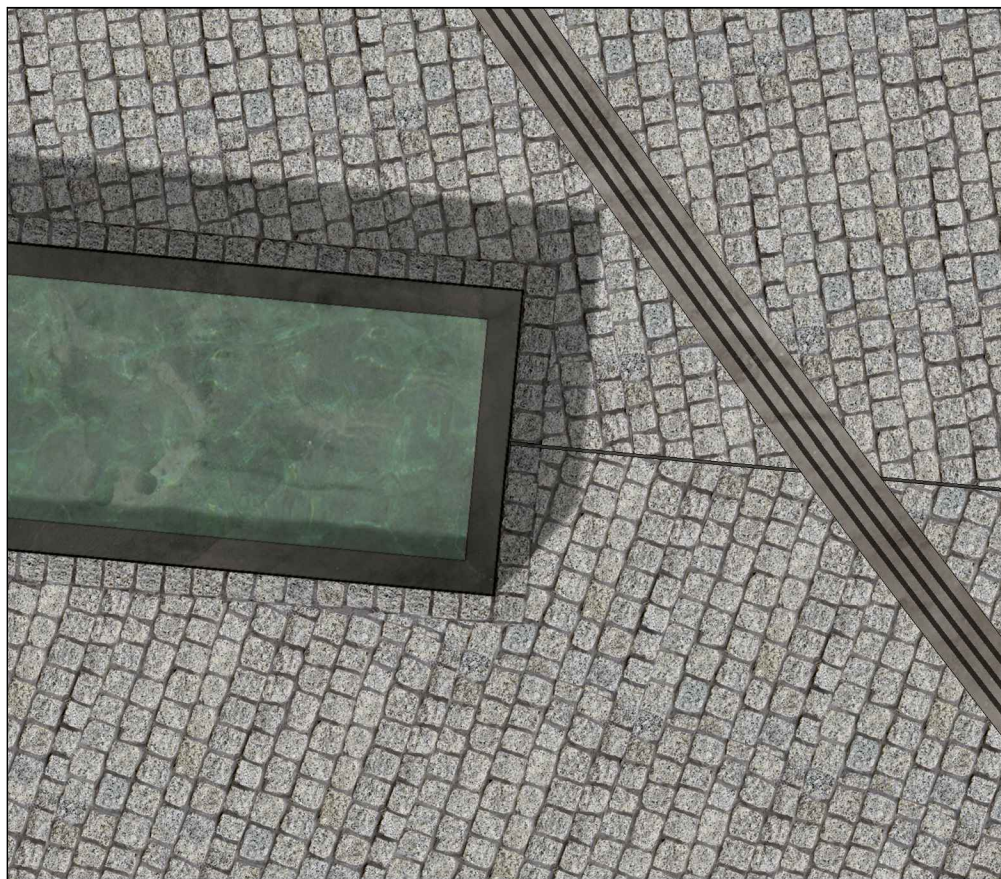
01. DETAIL- vodní prvek, ocelový pásek a vodící linie