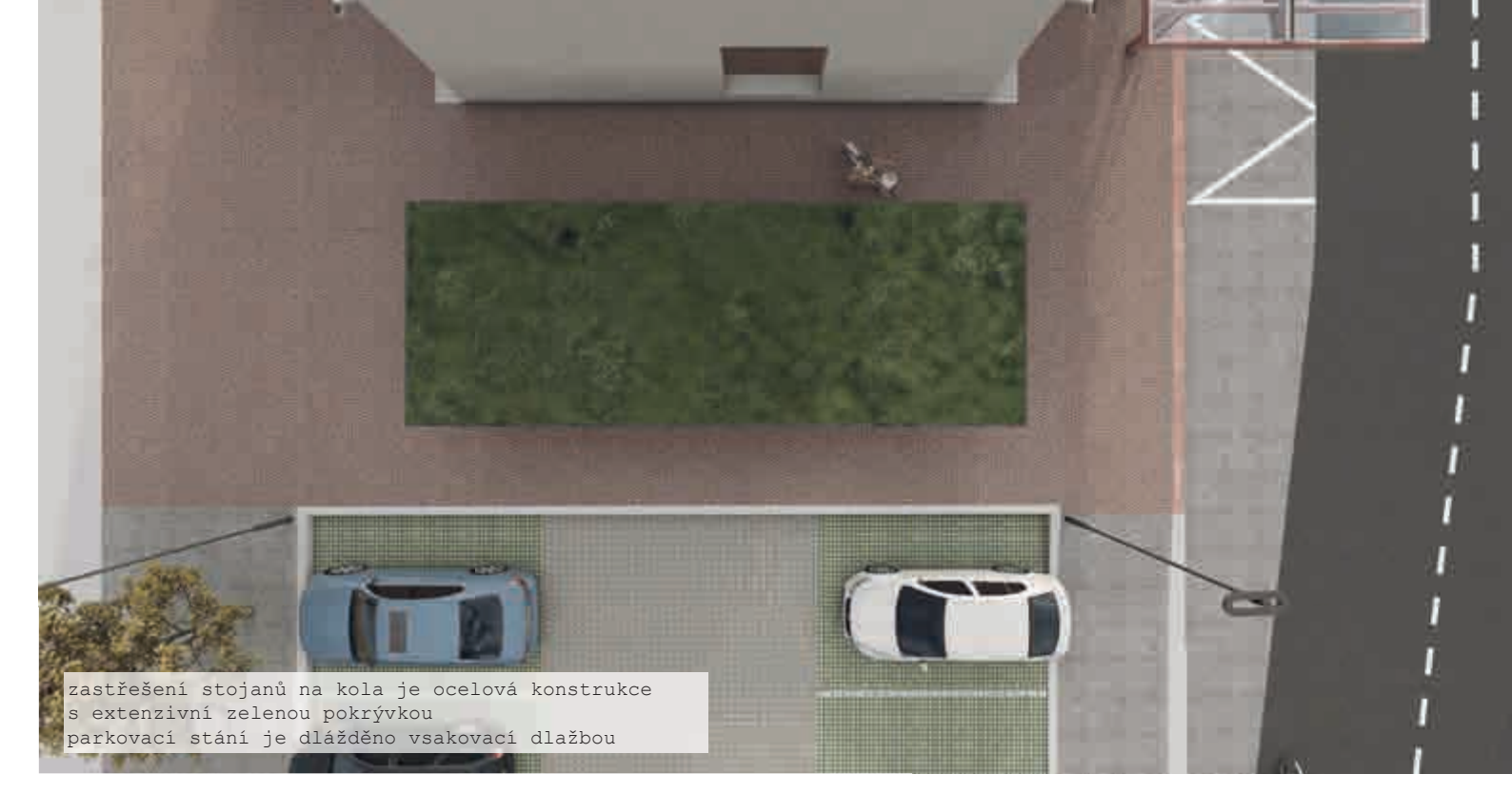
Zastřešení stojanů na kola je ocelová konstrukce s extenzivní zelenou pokryvkou parkovací stání je dlaždic vlakovými dlažbami