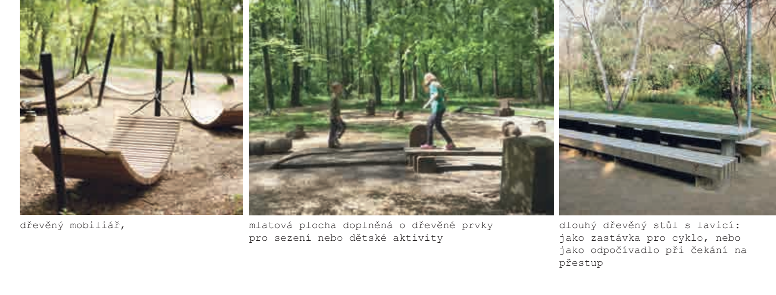
dřevěný mobiliář. místové plochy doplněná o dřevěné prvky pro sezení nebo dětské aktivity dlouhý dřevěný stůl a lavice: jako zastávka pro cyklo, nebo jako odpovídá při čekání na přestup