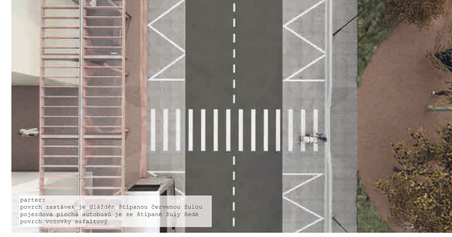
parter: povrch zastávek je dlaždic Štěpánou Červenou žulou pojednávací plocha autobusů je ze štěpáné žuly šedé povrch vozovky ztráskový