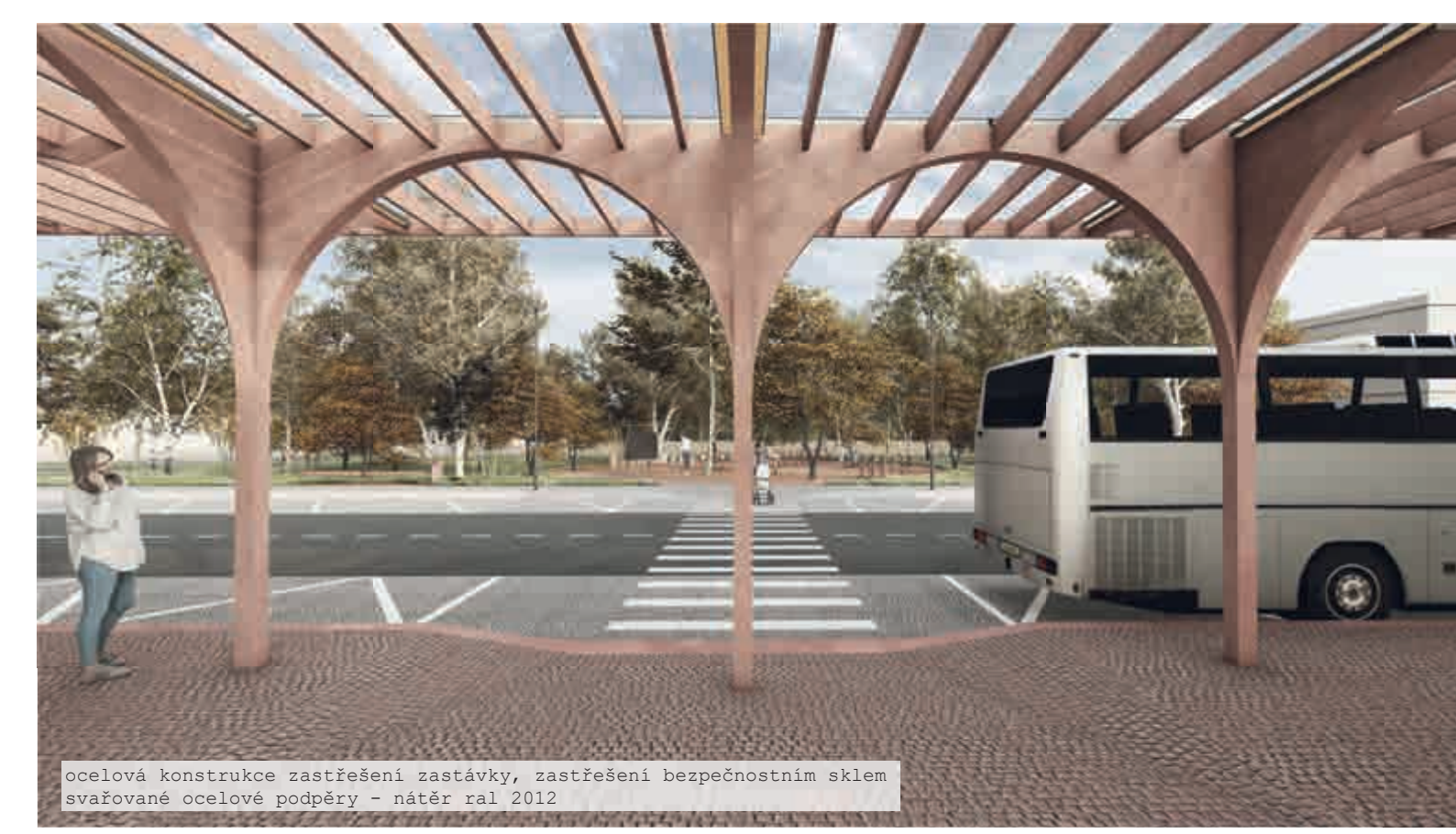
ocelová konstrukce zastřešení zastávky, zastřešení bezpečnostním sklem zastřešení ocelové podběhy - název: řal 2012